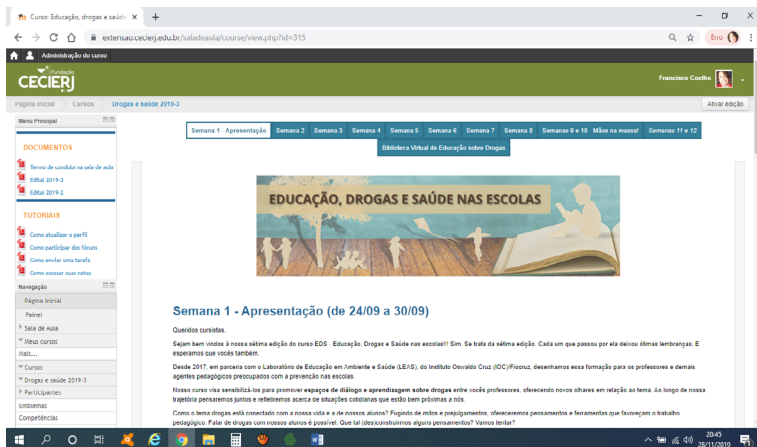
Figura 1 – Página do Curso Educação, Drogas e Saúde nas Escolas – 7ª edição (2019.3).