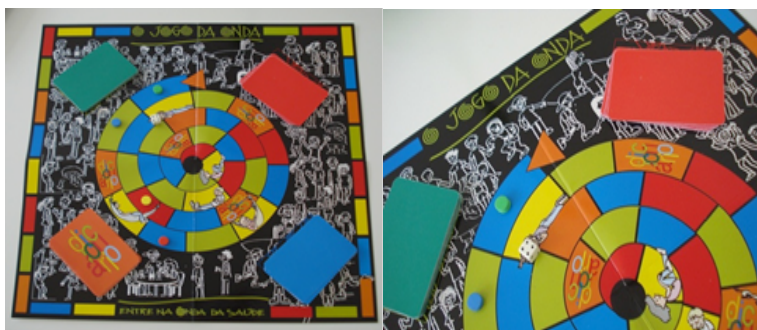
Figura 1 – Tabuleiro do jogo impresso.

Como indicado na figura adiante, o tabuleiro tem uma pista, no formato de uma espiral, alternando-se “casas” com cinco cores (azul, verde, laranja, amarelo e vermelho). Nas extremidades do tabuleiro encontram-se quatro espaços correspondentes às cores dos quatro baralhos.